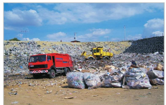
СВАЛАДАН ТЕЖАК ПУТ ОД СМЕТИЛИШТА ДО ДЕПОНИЈЕ: нишка депонија некад