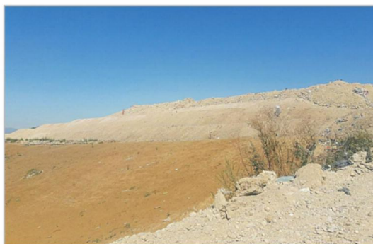
У СКЛАДУ СА ЕКОЛОГИЈОМ И ПОЗИТИВНИМ ЗАКОНИМА: нишка депонија сада

Планови које "Медиана" има за следећу годину су да се крене са компостирањем јер у Нишу 50 посто комуналног отпада чини биоотпад.