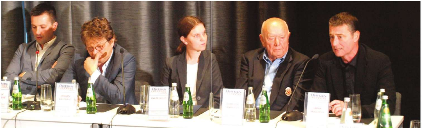
Panel-diskusija „Filmska industrija i poreska politika Srbije“ održana u Danas konferens centru