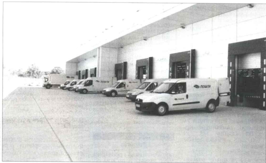
Pošta ima 1.400 vozila