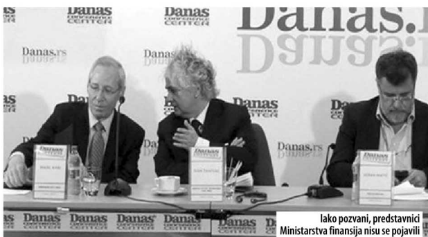
Iako pozvani, predstavnici Ministarstva finansija nisu se pojavili