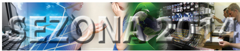
Hotel Hyatt Regency, 16. april 2014. godine