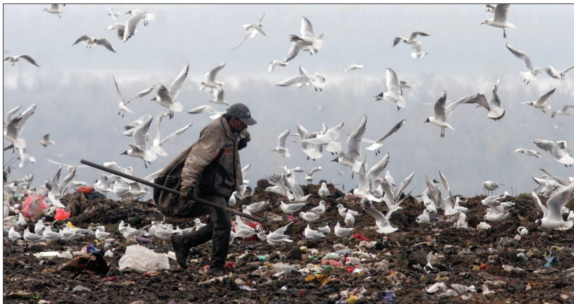
Može li reciklažna industrija da bude motor za sprovođenje politike „agresivnog“ zapošljavanja

žom. Na to ukazuje i podatak da je izdato oko 2.000 dozvola za upravljanje otpadom, bilo da je reč o transportu, skladištenju ili tretmanu tog otpada. Reciklažna industrija u Srbiji ima veliku perspektivu i mogla bi da bude motor za sprovođenje politike „agresivnog“ zapošljavanja koju najavljuje buduća vlada - kaže Filip Radović, direktor Agencije za zaštitu životne sredine Ministarstva energetike, razvoja i zaštite životne sredine. On je podsetio i na to da se približava 2020. godina kada više nećemo moći da izvozimo opasni otpad, što trenutno činimo. Radović je dodao da, uprkos tome što su obezbeđeni provajder i izvori finansiranja, nije pronađena adekvatna lokacija, „najviše zbog nerazumevanja lokalnog stanovništva“. Prisutnima na konferenciji obratio se i Jovica Božić, vlasnik reciklažnog centra „Božić i sinovi“, koji živi i radi na relaciji London-Beograd, a 2006. godine je