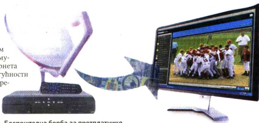
Беспашедна борба за претплатнике

oko 60 odsto tržišta u Srbiji obuhvaćeno je kablovskim operaterima koji vrše distribuciju kablovskim distributivnim mrežama (KDS), satelitskim komunikacijama (DTH), putem interneta (IPTV), a prisutne su i nove mogućnosti prijema putem bežičnih radio-mreža. Prema podacima Republičke agencije za telekomunikacije (RATEL), KDS sistemi pokrivaju 72 odsto pretplatnika, DTH 16, a IPTV 12 odsto. Međutim, sa pojavom kablovске