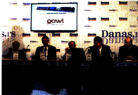
Više od pet odsto vrednosti celog IT tržišta odlazi na brojne naknade. Danas konferens centar

Istaknuto je da uvoznici roba čeka mesecima stoje na carini dok čeka ocenu usaglašenosti od domaćih sertifikacionih kuća, pri čemu gube ogroman novac ne samo zbog plaćanja ležarine, već i zbog kašnjenja na tenderima i zastarevanja modela roba koja je inače tehnološki osjetljiva. Uz to, podizanje PDV-a na tehničku robu, muzički dinar i drugi nameti koji dodatno opterećuju IT industriju nikako ne idu u pri-