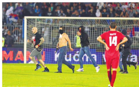
Нереди на утакмици Србија – Албанија