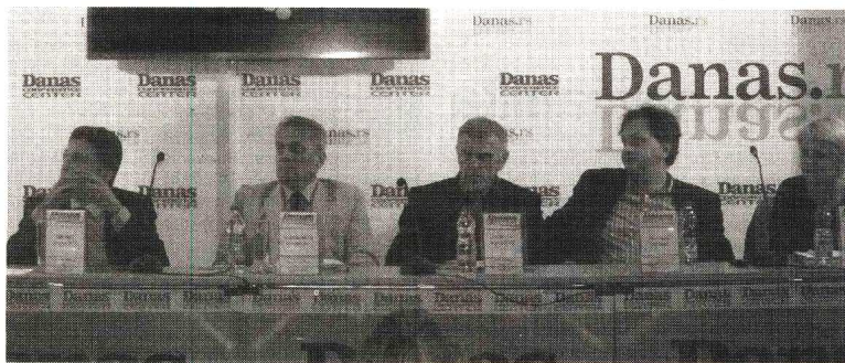
Udeo gledanosti nacionalnih stanica u kablovskom sistemu dostiže 62 odsto

Na konferenciji Danas konferens centra „Kablovski programi i tržište oglašavanja u Srbiji“, govoreći o tren-