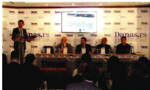
Sistem nastave u državnim školama u Srbiji prevaziđen: Sa jučerašnje konferencije

- Lepo je videti da ljudi sa Golije ili Stare planine veoma brzo mogu putem interneta saznati informacije, ali pripadnici