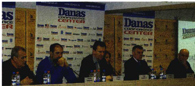
Uloga države u medijskom sistemu je pitanje kojim se određuje stav prema slobodi izražavanja: Učesnici panela

Na jučerašnjoj diskusiji, koju je organizovao „Danas konferens centar“, najviše je reči bilo o Nacrtu zakona o informisanju i medijima, o kom se inače poslednjih nedelja