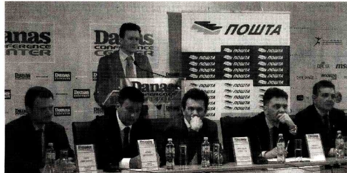
Panel-diskusija Danas konferencija centra - „Reciklažna industrija u Srbiji - Zakonodavni i investicioni okvir“