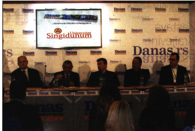
Konferencija Javno-privatno partnerstvo i obrazovni sistem Srbije održana u Danas konferens centru