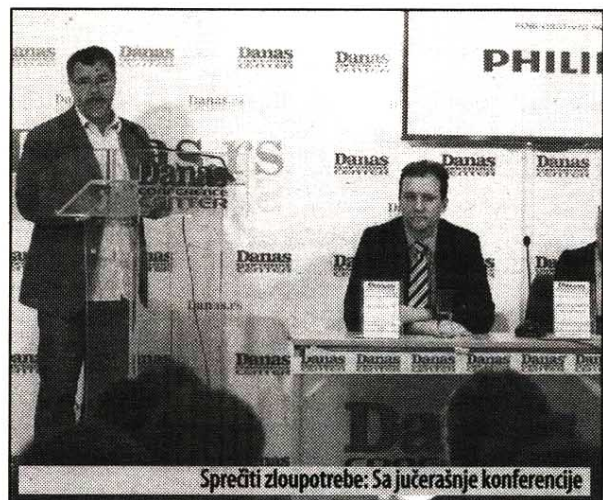
Sprečiti zloupotrebe: Sa jučerašnje konferencije

Za pet godina postojanja Fond B92 pokrenuo je niz akcija u kojima je pomogao brojnim pojedincima, ali su prikupljena i sredstva za kupovinu neophodnih aparata za zdravstvene ustanove. Tako je kupljen digitalni mamograf, više od 200 inkubatora i druge opreme za porodilišta, uložena sredstva u renoviranje klinika, uključujući i Urgentni centar.