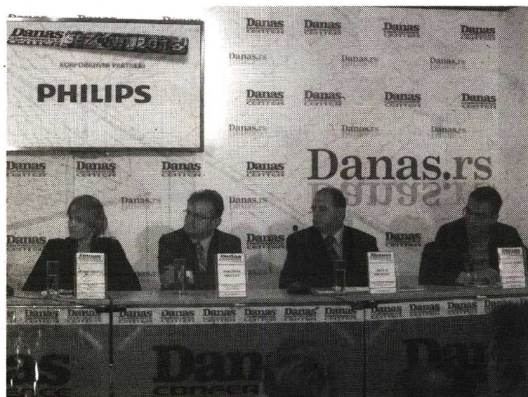
Carina i Pošta spremne za dramatičan rast internet trgovine: Panelisti Danasove konferencije

On je izneo i podatke za novosadsku carinarnicu u kojoj su u istom periodu ocarinjena 15.533 paketa kupljena preko Pejpala, za koje su primaoci platili dažbine u iznosu od 10,5 miliona dinara. Od toga se 10 miliona odnosi sa-