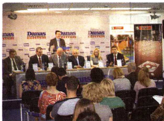
Svega 15 odsto otpada ide u reciklažu: Panel Danas konferens centra

- Od 2009. izdato je 2.200 dozvola za sakupljanje otpada. Planiramo da uposlamo 75 odsto više ljudi u ovoj oblasti, što će otvoriti 10.000 novih radnih mesta. Međutim, u Srbiji trenutno reciklira oko 15 odsto otpada, a taj procenat bi mogao da se poveća tako što bi se proizvodi od recikliranih materijala oslobodili barem dela poreza na dodatnu vrednost - ukazao je Vesić. Pre-