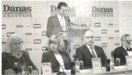
I zona sive ekonomije veliki neiskorišteni potencijal za punjenje budžeta: Okrugli sto o fiskalnoj disciplini

neto zarada u slučaju da poslodavac ne plaća doprinose. Odgovarajući na kritike banakara, koji tvrde da nije njihov posao da kontrolišu da li njihovi klijenti plaćaju porez ili ne, Radosavljević je rezonovao da će kontrolu i dalje sprovesti Poreska uprava, a da će banke samo sprečavati isplatu plata radnicima ako im nisu uplaćeni i doprinosi. Ali, čak i da je tako, i dalje postoji da takva fina teorijska distinkcija ne oslobađa banke neophodnosti da provere da li je njihov klijent izmirio poreske obaveze kako bi znale da li da puste njegovu uplatu radnicima ili da je zadrže.