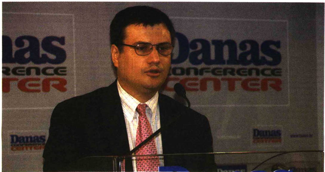
Povećati naplatu doprinosa: Bogdan Lisovolik

Prema njegovom mišljenju ključni problem je visoka potrošnja za penzije koja ne prati ekonomski rast. On je dodao da ljude treba stimulisati da što kasnije odlaze u penziju i povećati efektivne godine radnog staža i ukazao na primer nekih zemalja poput Italije i