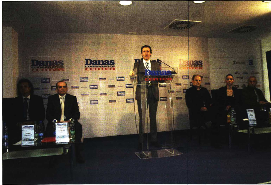
Prethodnih deset godina broj stanovnika u Srbiji smanjen za 200.000. Učesnici Danasove konferencije

u onaj bruto godišnji demografski minus od 45.000 ljudi.