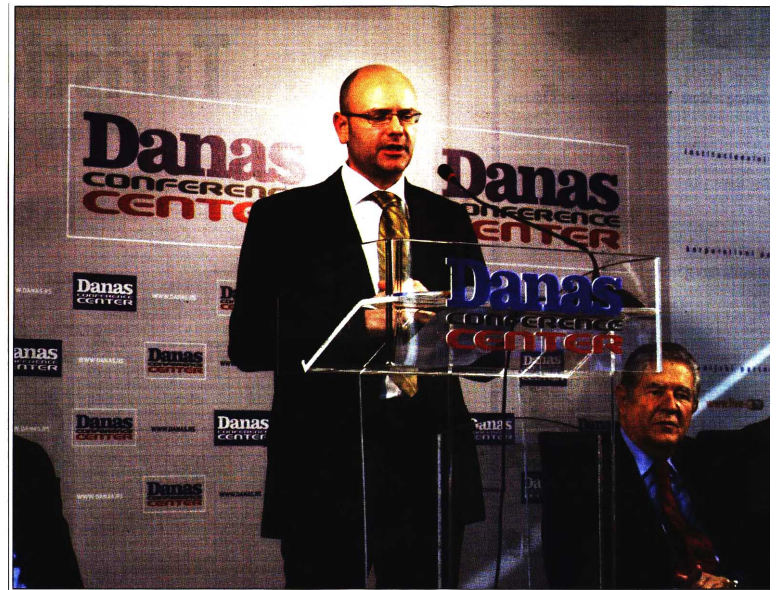
U prethodne tri godine u Srbiji otvoreno

Iz prezentacije koju je Ministarstvo ekonomije pripremio moglo se videti da je osim uspešnih ulaganja u turizmu poslednjih godina bilo i promašaja i da su rasplintane privatizacije četiri hotela - Splendida u Beogradu, Zelenkade na Zlatiboru, Fontane u Vrnjačkoj Banji i Srebrna na Kopaoniku. Šansu Beograda da privuče strance, zahvaljujući tome što je u poslednje vreme u svetskim medijima apostrofirana kao grad "zabave i ludog provoda", Petković vidi i u organizovanju različitih manifestacija koje bi pre svega okupile mlade. Jedan od takvih je i događaj Vajt senzejn koji će na jednom mestu okupiti oko 19.000 mladih, a očekuje se i dolazak oko 4.500 gostiju iz inostranstva. Događaji poput ovog gra-