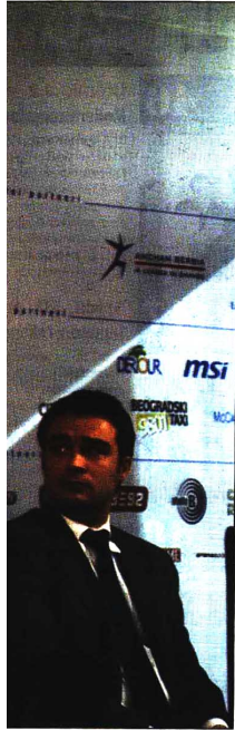
na 53 hotela: Neki od učesnika Danasove konferencije

ono propušteno u decenijama koje su ostale iza nas, ne obraćamo pažnju na neke suštinski važne stvari, a to je koliko je godina unazad o nama građena loša slika u svetu. Da li je potrebno da podsećamo koliko smo ratova, demonstracija, bombardovanja imali. To lako zaboravljamo, ali u drugim zemljama ne zaboravljaju tako lako. Zato bi, osim promocijama, trebalo da se pozabavimo i promenom imidža Srbije u očima drugih - tvrdi Đukanović.