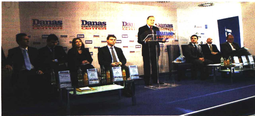
Industrija turizma u Srbiji još nije doživela procvat: Detalj sa konferencije

- Cenim sve što Vlada i Ministarstvo ekonomije rade, ali mislim da ne postoji jasan stav o značaju turizma za zapošljavanje ili regionalni razvoj. Ne tre-