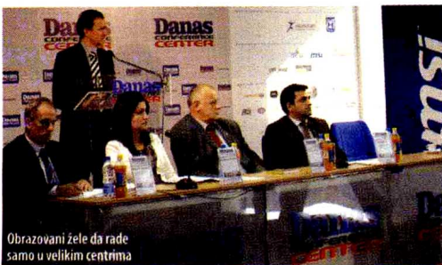
Obrazovani žele da rade samo u velikim centrima

- Ljudi napuštaju ruralna područja, što je jako pogodilo industriju šumarstva i dovelo do gubitka radne snage. Odgovor na to bilo je podizanje nivoa tehnološke opremljenosti preduzeća u šta je za zemlju kao što je Srbija bilo potrebno uložiti desetine miliona evra, kako bi smo mogli da se poredimo sa Evropom - istakao je Vasiljević. A. M.