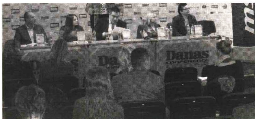
Ušteda je moguća kroz javne nabavke: Panel u Danas konferens centru

- Regulisanje cena pravi tržište nekonkurentnim. Kao što je ono liberalizovano kod onih lekova koji se ne uzimaju na recept, tako bi moglo i sa onima koji su na listi. Jedna od mogućnosti uštede je da se neopotrebnosti zastareli lekovi skinu sa pozitivne liste - ukazao je Bjelanović.